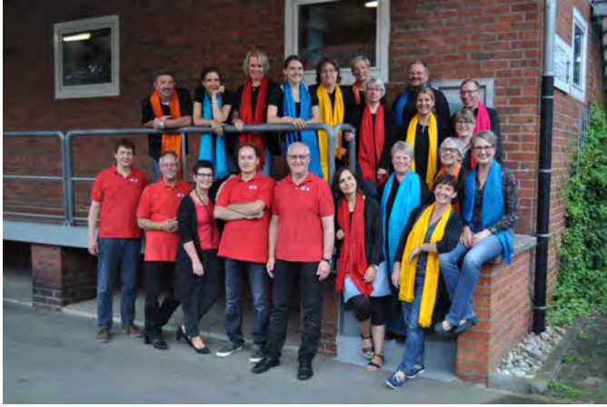
Der SpontanChor vor seinem Probenort, dem Kunsttreff Abbens

Andere Voraussetzungen? Freude am gemeinsamen Singen moderner christlicher Lieder.