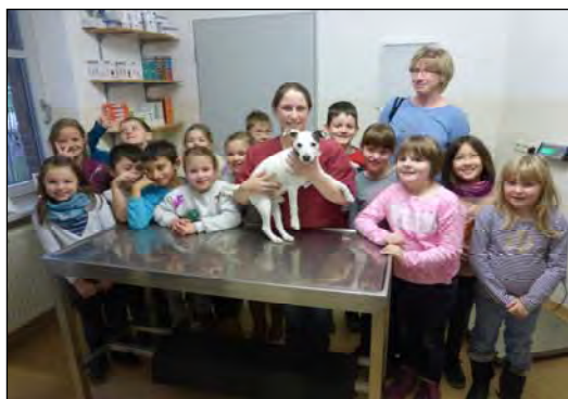
Der Nächste bitte auf den Untersuchungstisch! Nicht nur der Hund wurde untersucht, auch die Kinder konnten aktiv werden.

Wir bedanken uns bei der Praxis Heiber und Spickschen für die Zeit und die Informationen!