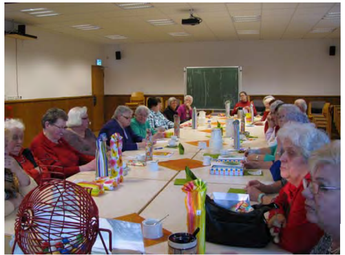
Bingonachmittag – Vorstellbar ist auch ein Spieleabend. Interesse?