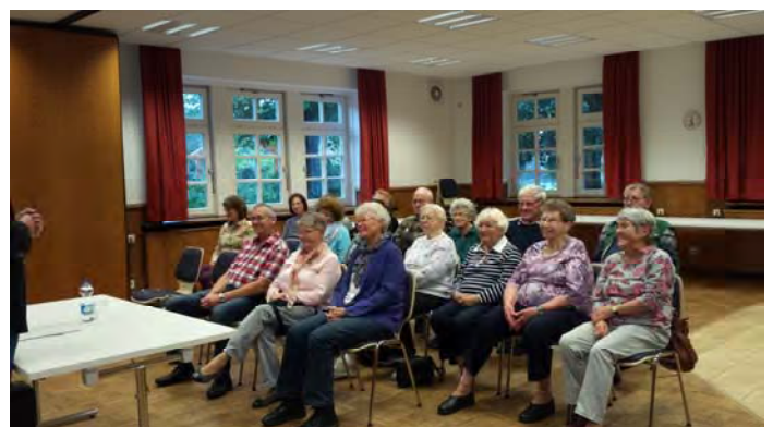
Vortrag der Polizei (Enkeltrick)