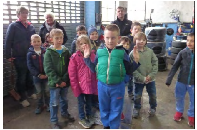
Der Besuch bei der Autobörse Guse