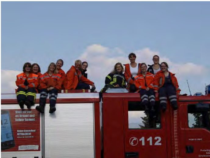
Junge Frauen wollen hoch hinaus

Die Frauen machen alles das, was auch Männer in der Freiwilligen Feuerwehr übernehmen. Sie bekommen die gleiche Ausbildung, Dienste und Fortbildungen. Im Bereich Brandbekämpfung werden Sie zum Tragen von Atemschutzgeräten und Taktischem Verhalten ausgebildet. Im Bereich Technische Hilfe im Umgang mit den dafür vorhandenen Gerätschaften. Um für die Aufgaben gerüstet zu sein, sollte Frau körperlich fit und nicht zimperlich sein. Mit einem gesunden Selbstvertrauen und einer tollen Mannschaft, sowie der Unterstützung der männlichen Einsatzkräfte, sollte dies aber eine leichte Aufgabe sein.