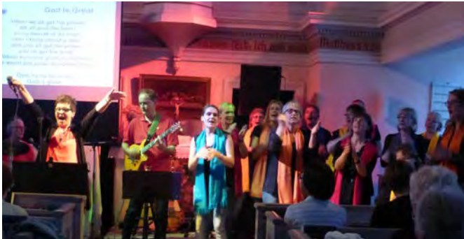
Kirchenlieder für die Straße, Gassenhauer für die Kirche: Konzert mit dem SpontanChor und der Band Kohelet im August 2017

Im Dorf hat es sich mittlerweile herumgesprochen: Wenn der SpontanChor auftritt, wird es bewegt, fröhlich, voll und alle gehen am Ende mit mindestens einem Ohrwurm und einem Lächeln nach Hause: Sänger und Mitsänger, denn Zuhörer gibt es bei diesen Gottesdiensten und Konzerten nicht. Die SpoChos sind ein Mitsingchor.