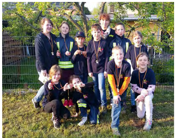
Kinderfeuerwehr in Zahna

Nach einem ausführlichen Kennenlernen und einem gemeinsamen Abendessen ging es bald für alle ins Bett, um Kraft für den nächsten Tag zu sammeln. Am Samstag begann der Tag mit einem gemeinsamen Frühstück. An den dann stattfindenden Wettkämpfen durften wir inoffiziell teilnehmen. Unsere zwei angetretenen Gruppen schlugen sich gut mit einen ersten und siebten Platz! Am Nachmittag nahmen wir dann noch an einer Stadtrally vom roten Kreuz teil, hier war ein dritter und ein vierter Platz unser. Den Rest des Tages verbrachten wir auf dem großzügigen Feuerwehrgelände bei vielen Spielmöglichkeiten und einer Hüpfburg. Am Sonntag ging es dann nach dem Frühstück für alle wieder nach Hause.