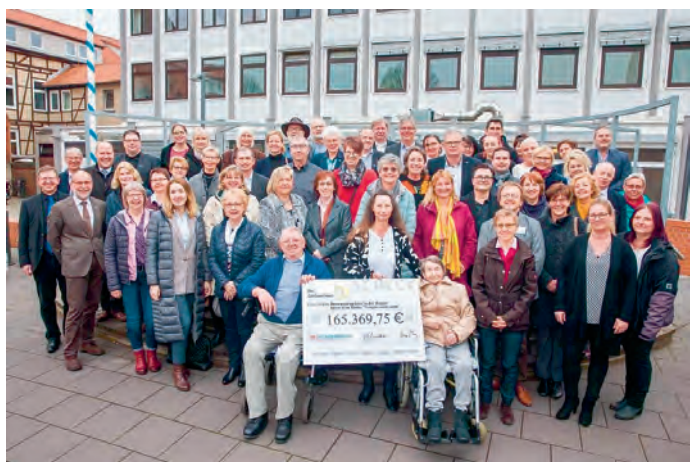
Preisverleihung „Goldenes Herz“

Im vergangenen Jahr wurden wir von der Braunschweiger Zeitung und dem Paritätischen Verein mit einer sehr großzügigen Spende in Höhe von ca. 11.000,00 € bedacht. Diese Spende ist zweckgebunden und muss innerhalb der kommenden zwei Jahre für Demenzprojekte eingesetzt werden, ansonsten ist das Geld zurückzuzahlen. Wir werden das Geld zum einen für ein weiteres Seminar im Betreuungs- und Entlastungsangebot einsetzen und zum anderen haben wir geplant, in Abbensen ein Treffen für Demenzkranke und ihre Angehörigen für die Gemeinde Edemissen ins Leben zu rufen.