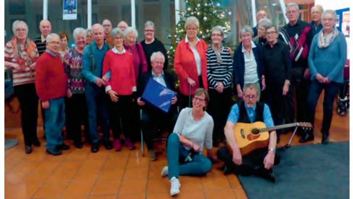
Parkinsongruppe Peine - Weihnachten 2019

Wir wollen der krankheitsbedingten Isolation der Patienten entgegenwirken und über die Gemeinschaft die persönliche und familiäre Situation stärken und verbessern, sowie den Betroffenen die Gewissheit geben, dass sie nicht Betroffenen die Gewissheit geben, dass sie nicht allein mit der Krankheit sind.