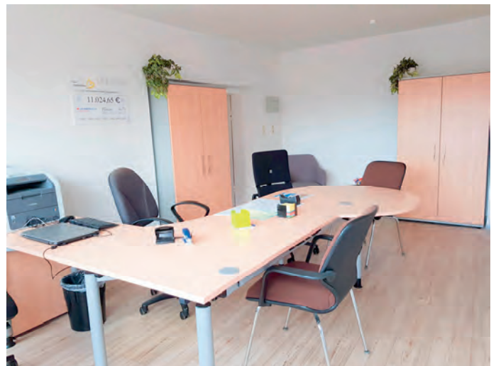
Unser neues Büro „Im Grünen Garten 5“ in Abbensen

Liebe Abbenser und Abbenserinnen, wir zählen auf Sie! Besuchen Sie uns gerne in unserem neuen Büro und machen sich selber ein Bild. Wir freuen uns auf Ihren Besuch!