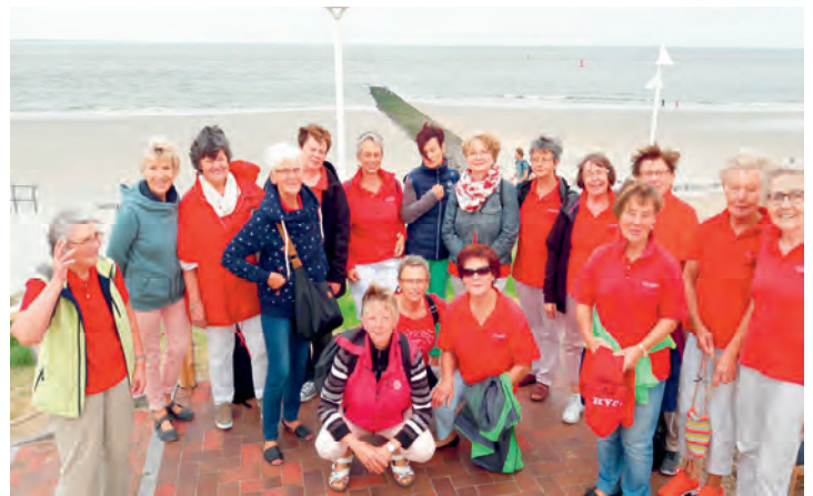
Gymnastikfrauen auf Reisen

Selbstverständlich sind auch die Gymnastikdamen nicht nur sportlich unterwegs. Ein jährlich wechselnder Festausschuss organisiert zahlreiche Aktivitäten: Winterwanderung, Städtetour, Fahrradtour, Wochenendausflug, Herbstwanderung, Weihnachtsfeier etc. Ein Höhepunkt ist die jährliche Teilnahme der Gymnastikdamen am bunten Umzug des Abbensener Schützenfestes.