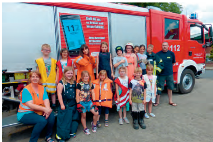
OhA! – Besuch bei der Feuerwehr 2019