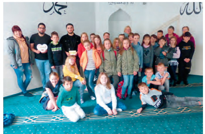
OhA! - Besuch in der Moschee 2019

Unsere Gymnastikgruppe trifft sich wöchentlich, mittwochs, von 17.00 Uhr bis 17.45 Uhr in den Räumen des Seniorentreffs „Wir sind für Euch da“ in Peine, Winkel 31 (neben dem Forum).