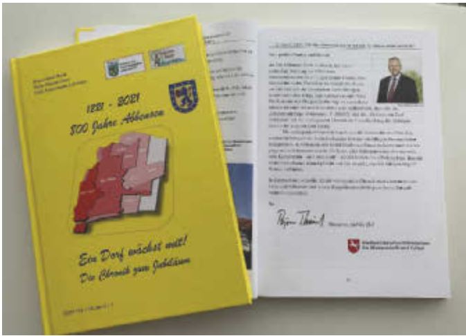
Buchdeckel mit Grußwort von Björn Thümler, Niedersächsischer Minister für Wissenschaft und Kultur