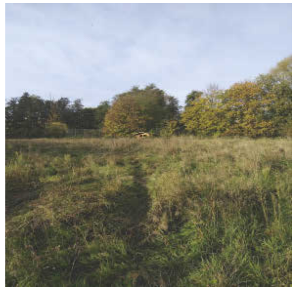
So sah es aus – Phantasie war gefragt

Mit sehr viel Freude haben wir ein neues Projekt gestartet - eine Streuobstwiese in Abbensen. Unterstützt wird das Projekt durch den Förderverein Dorf Abbensen, die Atgesellschaft Abbensen und die Jugendfeuerwehr. Das gemeindeeigene Grundstück liegt am Verbindungsweg nach Oelerse und grenzt direkt an die Kindergärten und die Schule. Auf diesem Gelände werden eine Streuobstwiese mit alten Obstsorten wie z. B. Äpfel, Pflaumen, Birnen, Zwetschgen, Kirschen und auch Sträucher wie z.B. Johannis- und Stachelbeeren gepflanzt, damit auch die Kleinsten Obst ernten können. Für Bienen und Insekten ist die Anlage einer Blühwiese mit Wildblumen vorgesehen und wir werden Insektenhotels in Zusammenarbeit mit den Kindergärten, der Schule und dem Garten & Landschaftsbau Uwe Ebeling herstellen. Herr Rohne hat seine Schafe für „Mäharbeiten“ zur Verfügung gestellt – vielen Dank dafür. Nachdem die Schafe ihre Arbeit weitestgehend erledigt hatten, sind die ersten Bäume durch die Fa. Uwe Ebeling bereits gepflanzt – auch die Kinder haben geholfen. Die Kosten sollen zum großen Teil über Umweltprojekte finanziert werden, aber wir freuen uns über jede Spende, z. B. auch als Baumpaten. Mit diesem Projekt sind wir auch bei „Gemeinsam Helfen“ der PAZ gestartet.