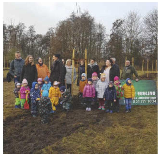
... und dann wurde gepflanzt