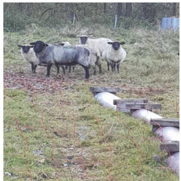
Vorbereitung durch die „Mäharbeiten“ ...