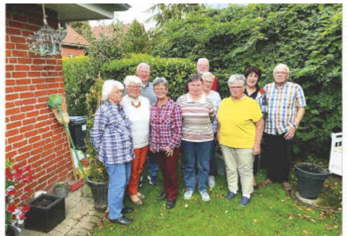
Der neue Vorstand

Für das nächste Jahr eine feste Planung zu erstellen, ist fast unmöglich. So beschränken wir uns darauf unsere Veranstaltungen wie Frühstück, Fahrradtour, Grillnachmittag, Herbstfest beizubehalten und eventuell um ein gemeinsames Matjes-Essen zu erweitern und die Veranstaltungen dann zeitnah bekanntzugeben.