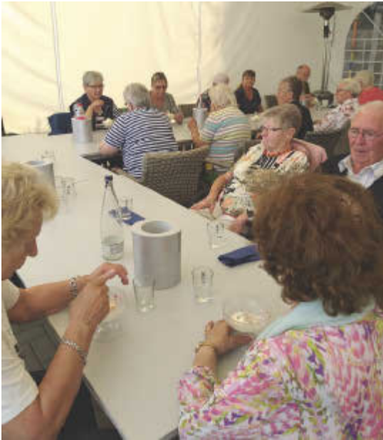
Mittagessen am Eixer See

Mit sehr viel Freude haben wir ein neues Projekt gestartet - eine Streuobstwiese in Abbensen. Unterstützt wird das Projekt durch den Förderverein Dorf Abbensen, die Atgesellschaft Abbensen und die Jugendfeuerwehr. Das gemeindeeigene Grundstück liegt am Verbindungsweg nach Oelerse und grenzt direkt an die Kindergärten und die Schule. Auf diesem Gelände werden eine Streuobstwiese mit alten Obstsorten wie z. B. Äpfel, Pflaumen, Birnen, Zwetschgen, Kirschen und auch Sträucher wie z.B. Johannis- und Stachelbeeren gepflanzt, damit auch die Kleinsten Obst ernten können. Für Bienen und Insekten ist die Anlage einer Blühwiese mit Wildblumen vorgesehen und wir werden Insektenhotels in Zusammenarbeit mit den Kindergärten, der Schule und dem Garten & Landschaftsbau Uwe Ebeling herstellen. Herr Rohne hat seine Schafe für „Mäharbeiten“ zur Verfügung gestellt – vielen Dank dafür. Nachdem die Schafe ihre Arbeit weitestgehend erledigt hatten, sind die ersten Bäume durch die Fa. Uwe Ebeling bereits gepflanzt – auch die Kinder haben geholfen. Die Kosten sollen zum großen Teil über Umweltprojekte finanziert werden, aber wir freuen uns über jede Spende, z. B. auch als Baumpaten. Mit diesem Projekt sind wir auch bei „Gemeinsam Helfen“ der PAZ gestartet.