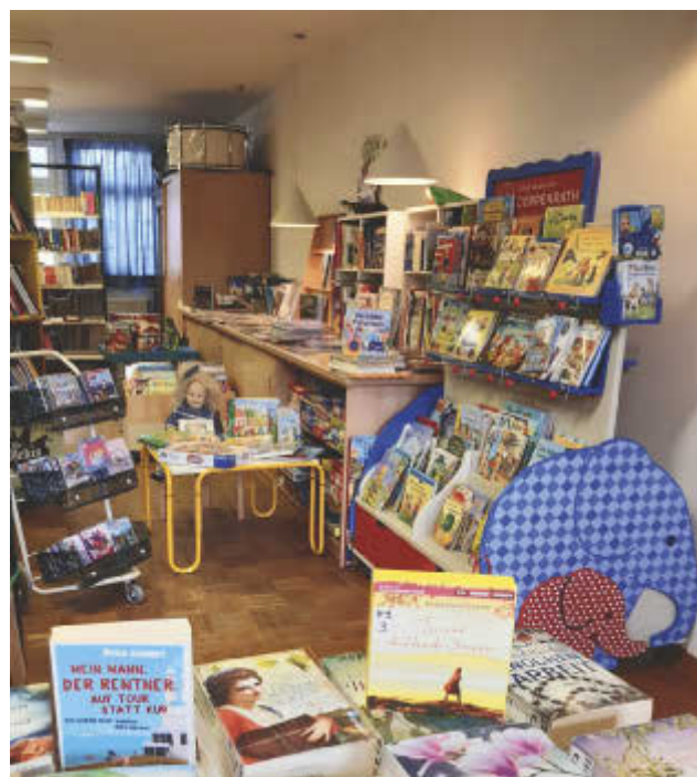
Eine kleine Bücherauswahl